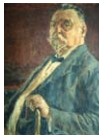
Felix Urban Cambon, Vladimir Desnica , ulje na platnu, 1913.

Ilijina kćerka, grofica OLGA DEDE-JANKOVIĆ, zaljubljenica u svoj islamski dom i porodičnu tradiciju, udala se za Vladimira Desnicu.